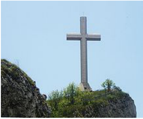
Paroisse La Croix-du-Nivolet